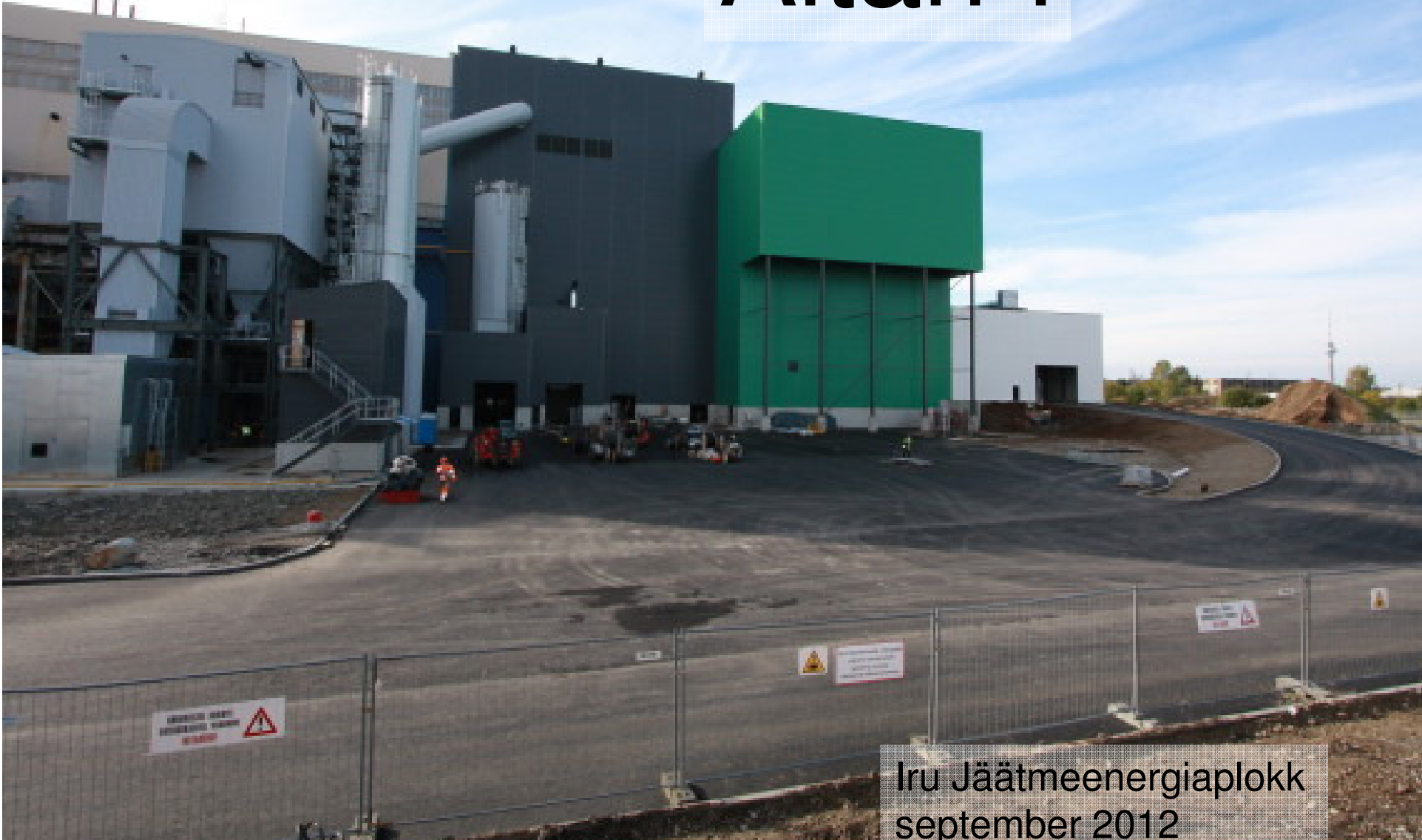
Iru Jäätmeenergiaplokk september 2012